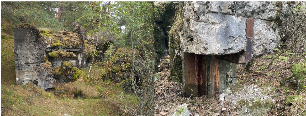
Fot. 02. Niedysięjsza ściana boczna ze strzelnicą ckm chronioną pancierzem pionowym.

Kontemplując o fortyfikacjach Odcinka "Sarny" pierwszy na myśl przychodzi zapewne schron Mokwin 5 "Mat" lub rozproszone obiekty 6 i 9 spod Lubaszy. Następne do głowy przychodzą zapewne roboty hydrotechniczne i planowane bezkresne zalewy. Wreszcie inne imponujące dzieła jak np. Kamienne 5 "Obuch" czy Antonówka 4 "Junak". W tym gąszczu niezwykle ciekawych budowli ginie schowany w sąsiedztwie obiektów z poterną: 19 i 19a pod Czudlem niepozorny lecz niezwykle interesujący schron Czudel 18 o kryptonimie "Wacek". Mimo że został wysadzony zdecydowanie warto przyjrzeć się mu bliżej.