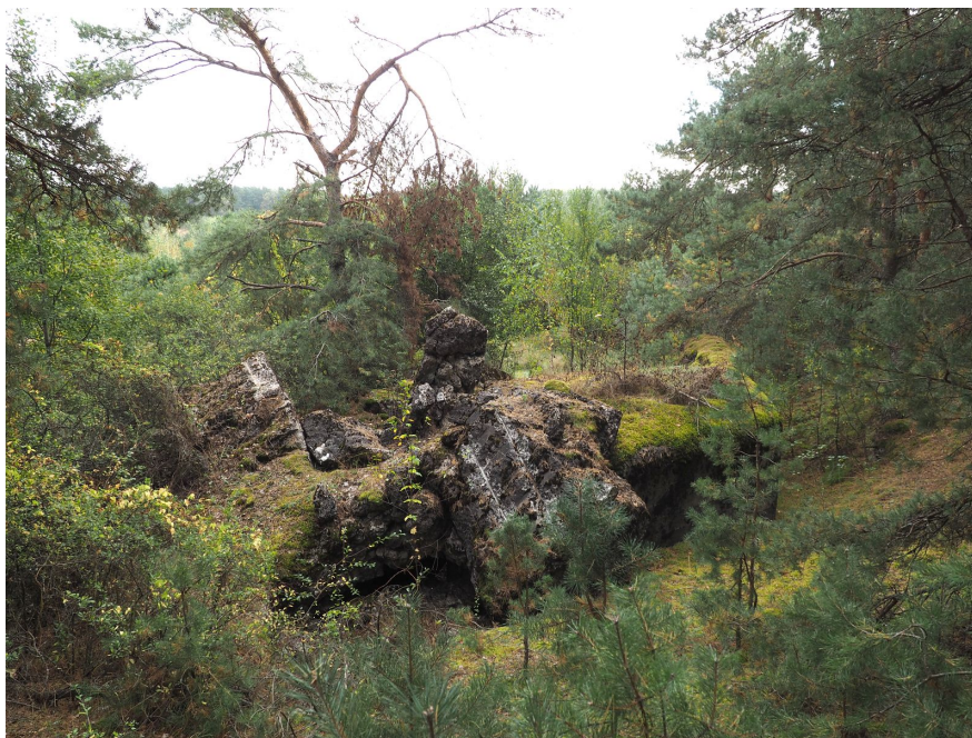
Fot. 01. Schron widoczny z wydmy od strony obiektów 19 i 19a.

Kontemplując o fortyfikacjach Odcinka "Sarny" pierwszy na myśl przychodzi zapewne schron Mokwin 5 "Mat" lub rozproszone obiekty 6 i 9 spod Lubaszy. Następne do głowy przychodzą zapewne roboty hydrotechniczne i planowane bezkresne zalewy. Wreszcie inne imponujące dzieła jak np. Kamienne 5 "Obuch" czy Antonówka 4 "Junak". W tym gąszczu niezwykle ciekawych budowli ginie schowany w sąsiedztwie obiektów z poterną: 19 i 19a pod Czudlem niepozorny lecz niezwykle interesujący schron Czudel 18 o kryptonimie "Wacek". Mimo że został wysadzony zdecydowanie warto przyjrzeć się mu bliżej.