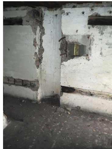
Fot. 04. Podłoga maszynowni schronu. Największy betonowy postument to łączona podstawa silnika i prądnicy. Obok niej czerpniowego. Obok półkolistą wnęką dla pieca. Po prawej stronie mniejszy cokół służący dla wentylatora mechanicznego. Fot. od niej strzelnica broni ręcznej obrony wejście.

Obiekt nr 18 został wybudowany w 1937 r. Usytuowany jest u podnóża wydmy, na której szczycie znajdują się obiekty 19 i 19a. Wykonany został w klasie odporności na ostrzał "D", co przekładało się na wytrzymałość na pociski kalibru do 220 mm. Schron uzbrojony był prawdopodobnie w 2 ckm i 1 rkm, co jednak nie przekłada się na liczbę stanowisk do prowadzenia ognia, ponieważ posiadał trzy ściennie strzelnice ckm, jedną ścienną strzelnicę rkm oraz prawdopodobnie jedną kopułę obserwacyjną-rkm. Różnica wynika z ogólnie przyjętej na Polesiu zasady manewru ogniem wewnątrz schronu, co polegało na przenoszeniu broni między strzelnicami. Na głównym, silnie czołowym kierunku ognia, schron posiadał dwie strzelnice ckm, rozłożone wachlarzowo, osłonięte pancierzami pionowymi. Dodatkowo posiadał jedną strzelnicę ckm chronioną zwykłym pancierzem typu 37 tzw. pgaz. skierowaną w bok i nieco w tył.