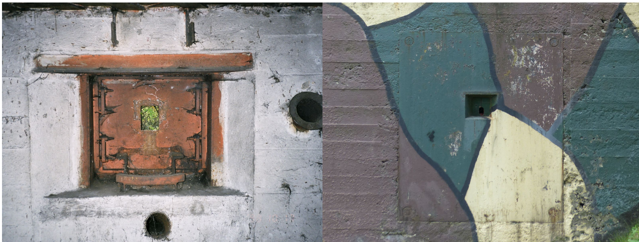
Fot. 06. Strzelnica ckm typu 37 w schronie Godula 14 (Górny Śląsk). Osprzęt pancerza niekompletny. Stan w 1998 r. Fot. 07. Pancerz pionowy typu 37 w schronie II linia 39 (Górny Śląsk). Malowanie jest ahisteryczne.

łatwo wymiennego pancerza z wnętrza schronu. W maszynowni rezerwowo wentylator ręczny przykręcono bezpośrednio do podłogi – jest to starsze rozwiązanie, z 1936 r., w 1937 r. wylewano dlań betonową podstawę o wysokości ok 10 cm, aby wygodniej można było go napędzać. Podobnie czerpnia powietrza i cały układ wentylacji pochodzą z 1936 r. - w 1937 r. stosowano już wentylację podłogową, podczas gdy w 1936 r. przewody wentylacyjne podwieszano pod sufitem. W obecnym stanie schronu (czyli znacznego wysadzenia) trudno znaleźć więcej przykładów, jednakże te wymienione są wystarczające, by stwierdzić, że schron posiada miazg rozwiązań konstrukcyjnych z dwóch etapów budowlanych, co jest pokłosiem zmian wprowadzonych do projektu korzystając z opóźnień w pracach budowlanych. Być może uznano, że strzelnica jest narażona na ogień lub dopuszczano możliwość adaptacji dla armaty ppanc, do czego dogodniejsza była strzelnica nowego typu. Zastanawiające jest jednak dlaczego wprowadzono dużą zmianę, jaką jest nowy typ strzelnicy, a nie wykonano podstawy dla wentylatora, która nie wymaga znacznych modyfikacji rysunków wykonawczych.