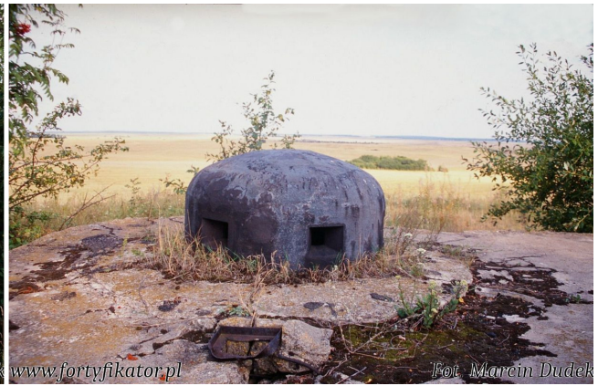
Fot. 10, 11. Pododcinek "Horodyszcz", schron dowodzenia w rejonie Zaosia. Nad wejściem widoczne jest zagłębienie na oparte skośnie belki tworzące drewniano-ziemną przelotnię. Widoczna kopuła i otwór peryskopu. W tle, ponad stopem w dalszej perspektywie widoczne zabudowanie folwarku Mickiewiczów w Zaosiu.