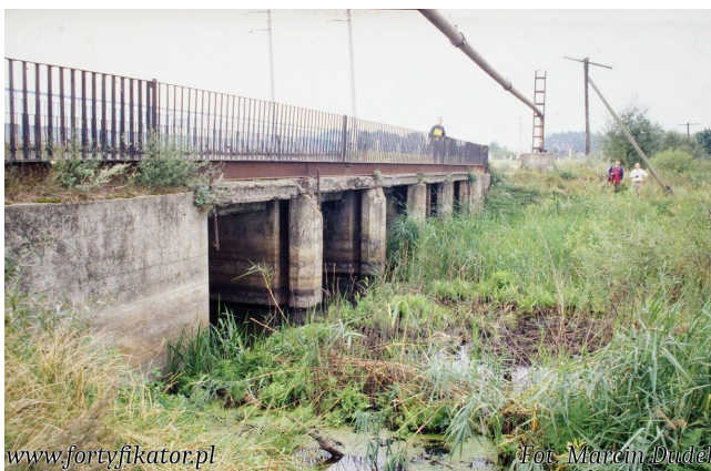
Fot. 06. Jaz obecnie pełniący rolę mostu.