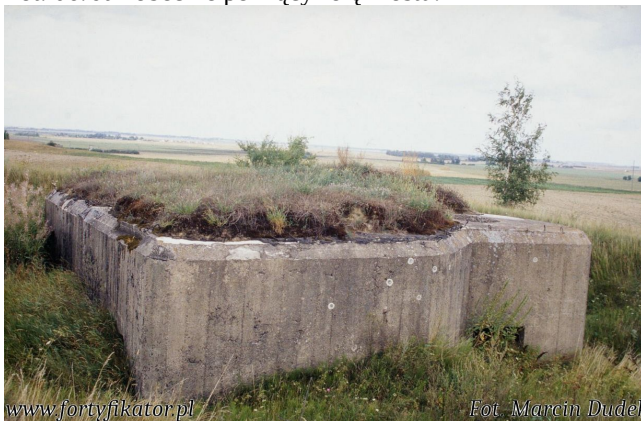
Fot. 08. Strop typowego obiektu z 1937 r. dobrze ilustruje trapezową bryłę dzieła.