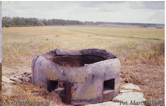
Fot. 12. Schron dowodzenia Darewo 24. Pagórek, na którym zbudowano obiekt został po 2 wojnie światowejNa kopule widoczne zachowane jeszcze ślady farby rozkopany kopany aby powiększyć i zniwelować okolicznemaskowania. Kolor mocno rozbielonego różu może być kołchozowe pole. Widoczny otwór po lewej stronie to efektem płowienia. Jednak można go spotkać praktycznie na wszystkich zachowanych kopułach tego typu.