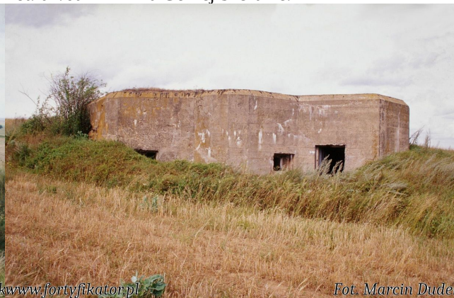
Fot. 09. Jeden z obiektów z 1937 r. w rejonie Darewa.