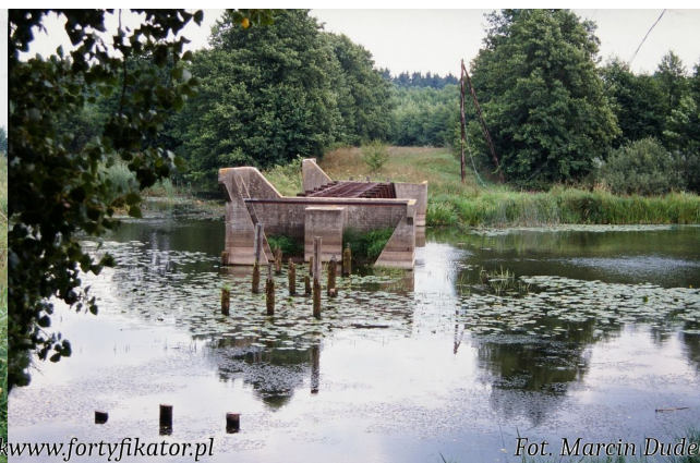
Fot. 07. Jaz nr 11 na Górnjej Szczarze.