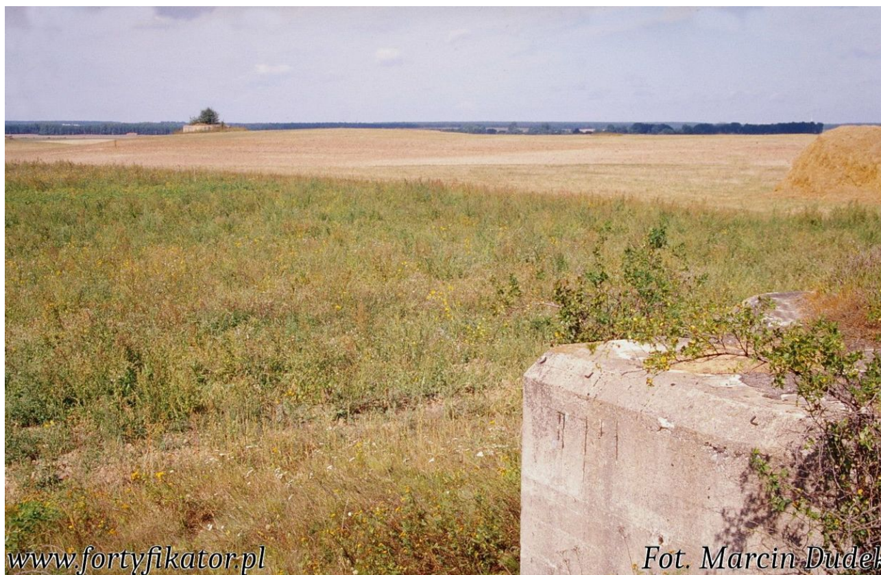
Fot. 01. Widok ze stropu schronu na krajobraz Nowogródszczyzny.

W okresie międzywojennym do mobilizacji z 23 marca 1939 r. główny wysiłek fortyfikacyjny II Rzeczypospolitej koncentrował się na trzech pozycjach. Na wschodniej granicy były to Odcinek "Sarny" oraz Odcinek "Baranowicze", a na zachodniej tzw. Obszar Warowny "Śląsk". Największym przedsięwzięciem był Odcinek "Sarny", projektowany jako fortyfikacja klasy "obrona pozycyjna" do stawiania oporu przez długi czas, będący polskim odpowiednikiem "frontu ufortyfikowanego". Był jednak budowany stosunkowo krótko, ponieważ jego wznoszenie rozpoczęto w 1936 r., a przerwano (i nie wznowiono) w 1938 r. Po drugiej stronie granicy wojsko prowadziło budowę tzw. Obszaru Warownego "Śląsk" przeznaczonego początkowo do obrony przeciwko niemieckiemu powstaniu na Górnym Śląsku i ewentualnej odsieczy udzielonej przez wojsko, słabą wówczas Reichswehrę. Jego budowa trwała od 1933 r. aż do wybuchu wojny, co przełożyło się na mnogość rozwiązań technicznych wprowadzanych w różnych latach.