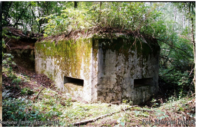
Fot. 02. Schron zmodernizowany w pierwszej połowie lat 30. Widoczne inne szalowanie w rejonie czołowej strzelnicy.