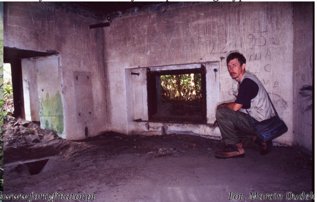
Fot. 14. Ściana boczna ze strzelnicą schronu obrony przeciwpancernej Minicze 2 (1938). Po lewej stronie ucholewej wjazd dla armaty, przeznaczony do zamknięcia (orylion) osłaniający strzelnicę od przedpola.